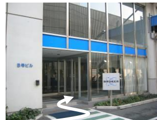
④B棟入口 6F アプリケーション・サポートセンター (デモルーム)