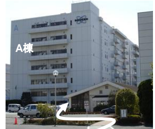
②安田倉庫守衛を通過付近