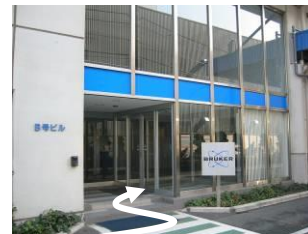
④B棟入口 6F アプリケーション・サポートセンター (デモルーム)